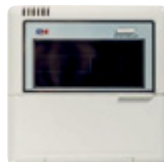
Juhtmega kontroller CE50-24/E