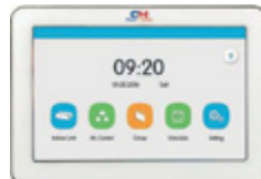
Juhtmega kontroller CE52-24/F