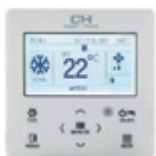
Juhtmega kontroller XK76