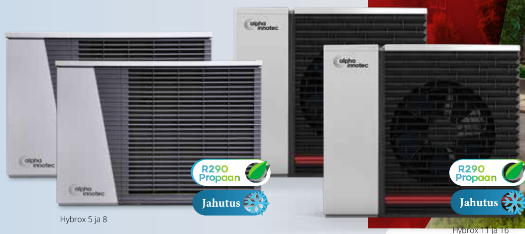
Hybrox 5 ja 8

Neli erinevat võimsust - Hybroxi tipptasemel seadmed hoolitsevad teie küttevajaduse eest nii uuseramutes kui vanades ja väärikes majades. See kõrge efektiivsusega, võimekas soojuspump hoolitseb teie kodu meeldiva sisekliima eest. Aastaringelt.